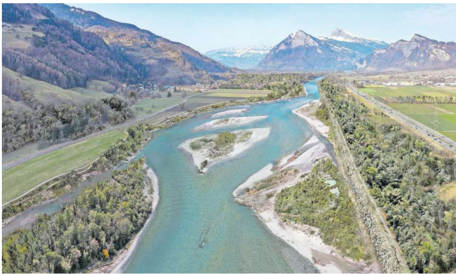
Blick nach Norden: Visualisierung der geplanten Rheinaufweitung bei Maienfeld/Bad Ragaz.

Auch die Bevölkerung ist eingeladen sich im Rahmen